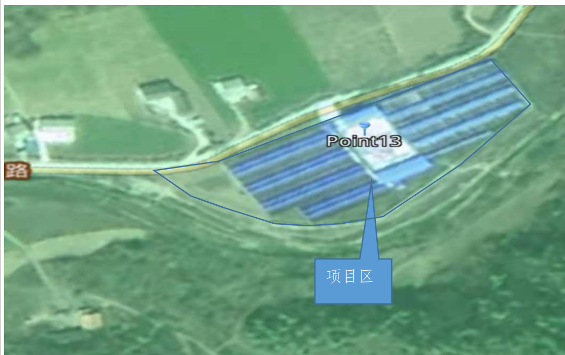
图 1-1 项目区地理位置影像图