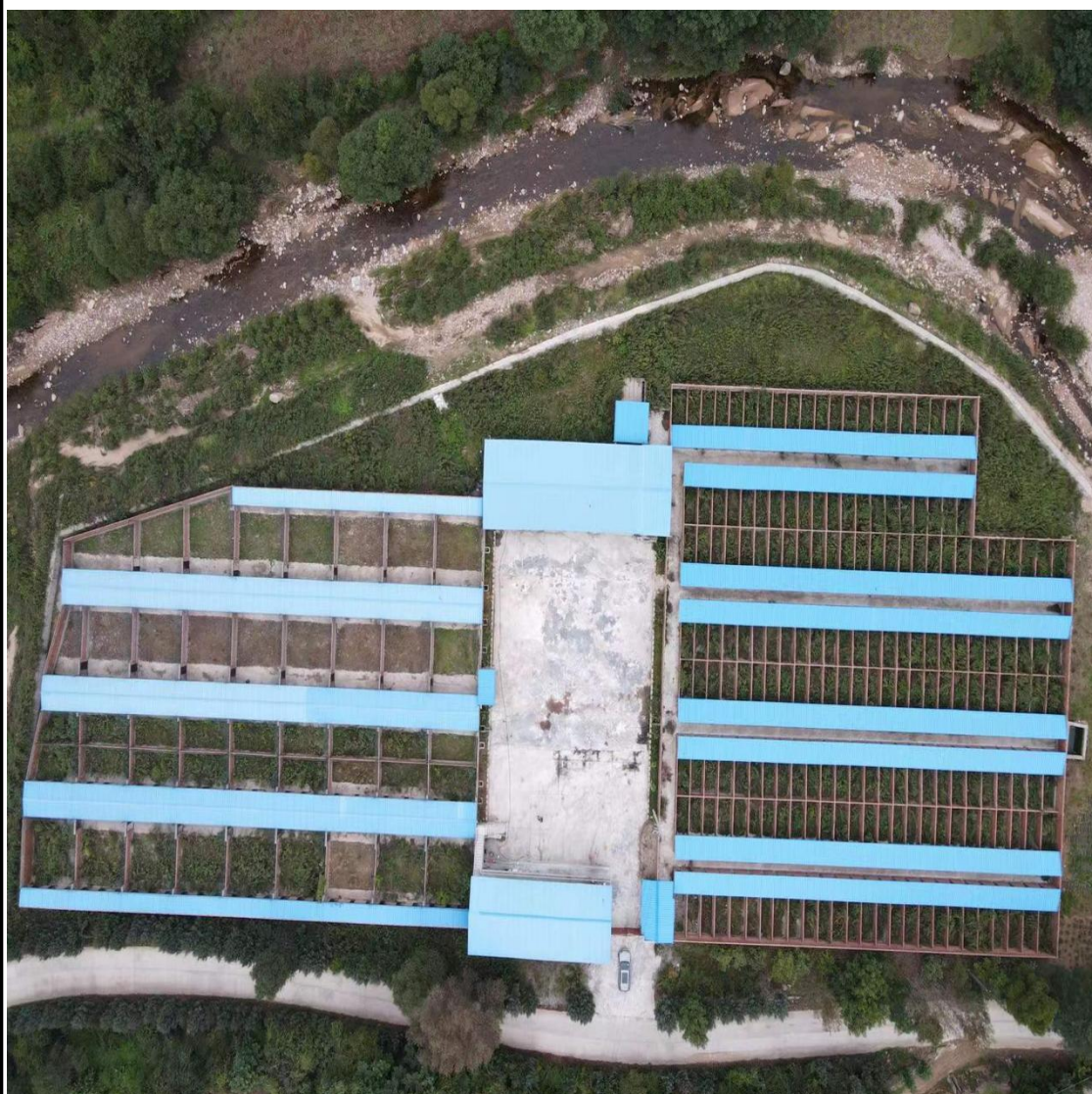
图2-1项目总平面布置

《唐藏镇林麝繁育基地》项目总占地面积 1.22hm 2 ，属设施农业用地。场地内无拆迁物。环境卫生良好，基本满足本项目建设要求。项目区主要由办公生活区、养殖区、绿化区等区域组成。其余空地区域布置集中景观绿化。绿化分布在组团各处，建筑与环境融为一体。项目区分布图见总平面布置图 2-1。