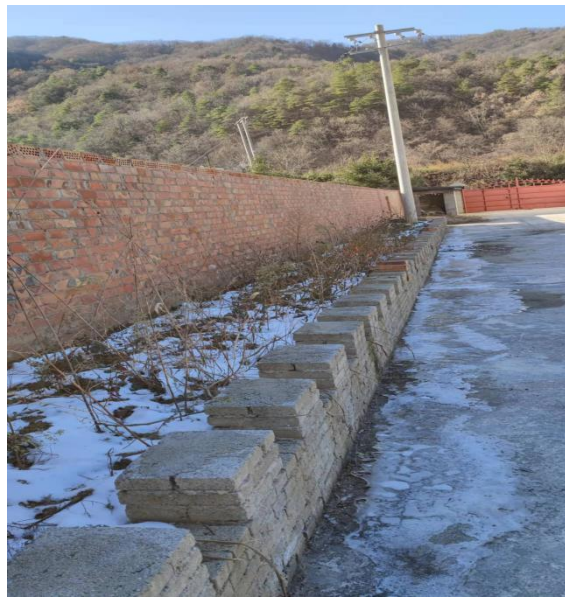
办公区围墙周边绿化带