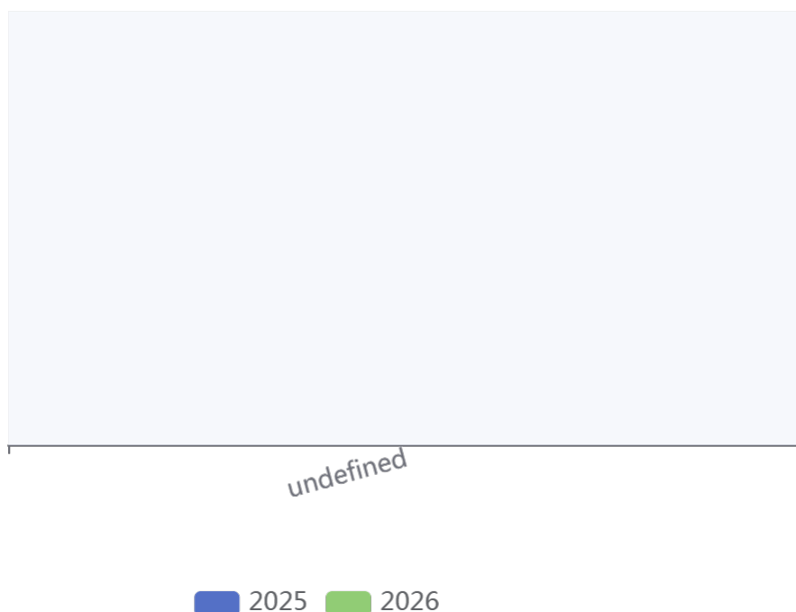
支出按政府预算支出经济分类对比图

(1) 对事业经常性补助(505)1381.53万元，较上年减少183.67万元，下降11.73%，下降的主要原因是：凤县县城城乡一体化服务项目预算资金减少。